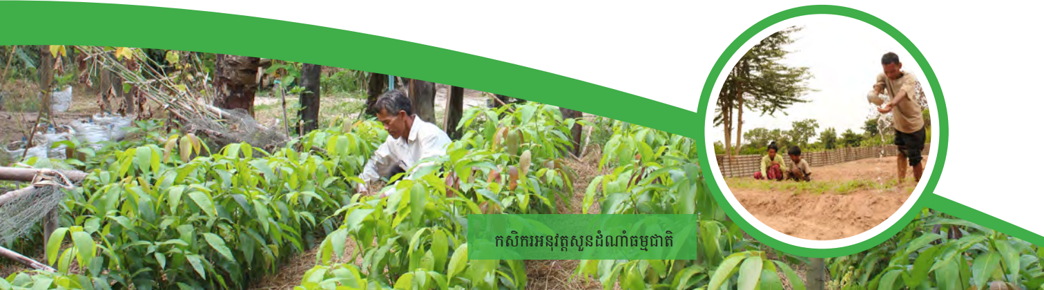
កសិករអនុវត្តស្នូនដំណាំធម្មជាតិ