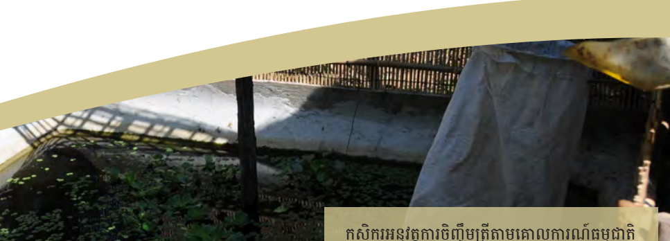
កសិករអនុវត្តការចិញ្ចឹមត្រីតាមគោលការណ៍ធម្មជាតិ